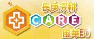
(節目暫定，以現場節目表為主)