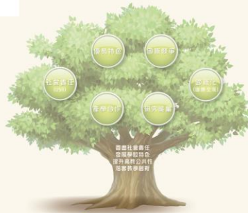
主辦單位：教育部 承辦單位：長庚科技大學

活動內容來自長庚科大護理學院、民生學院6個系所共同聯合成果展，除此之外活動現場舞台區每日還有精彩的動態表演，應有盡有，好禮三重送趣味闖關遊戲、好康大抽獎等，讓參與民眾體驗一場最有趣的卓越高等教育計畫之旅。