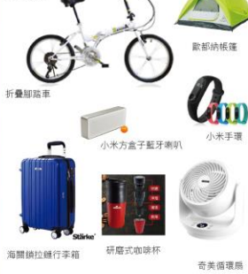
圖片顯示內容僅供參考以實體為主，主辦單位有權調整獎品內容及數量